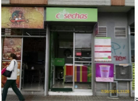
Fotografía No. 1: Establecimiento COSECHAS, el cual se encuentra ubicado en la dirección CARRERA 28 A No. 53 A – 66 L 20. □

Registro fotográfico, Visita No. 1 efectuada el día 30/07/2015